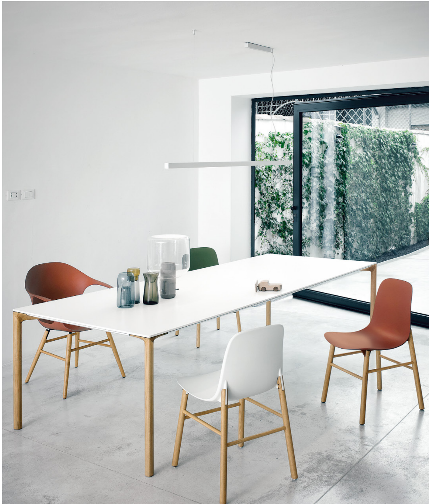
chair : 参考商品 ※SHARKY (上部白のみ取扱あり)