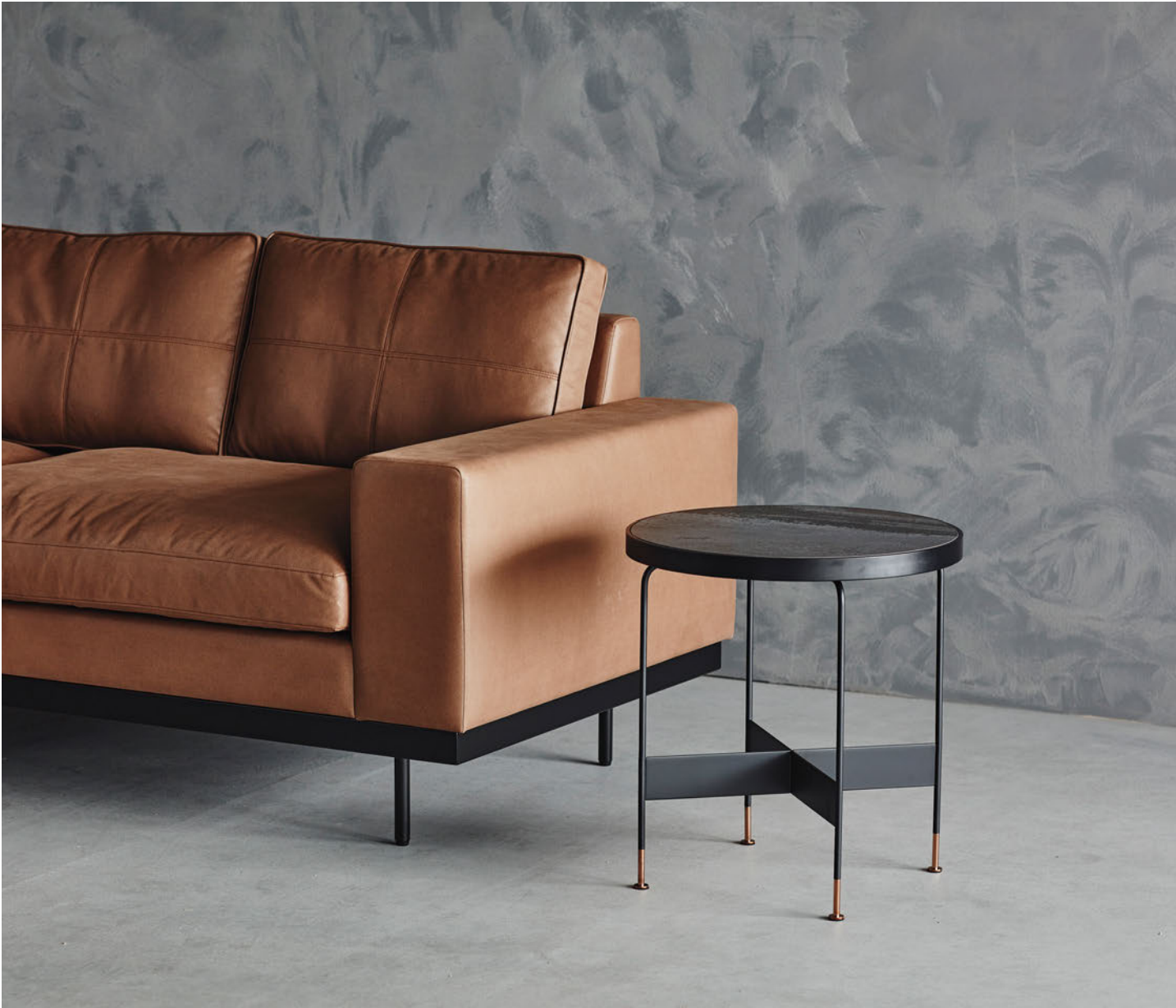
sofa : KUMO