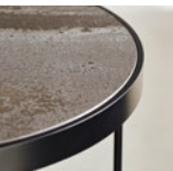
2. セラミック天板 小口／MDF