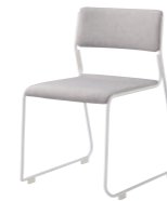
張地 / Bランク NC-125