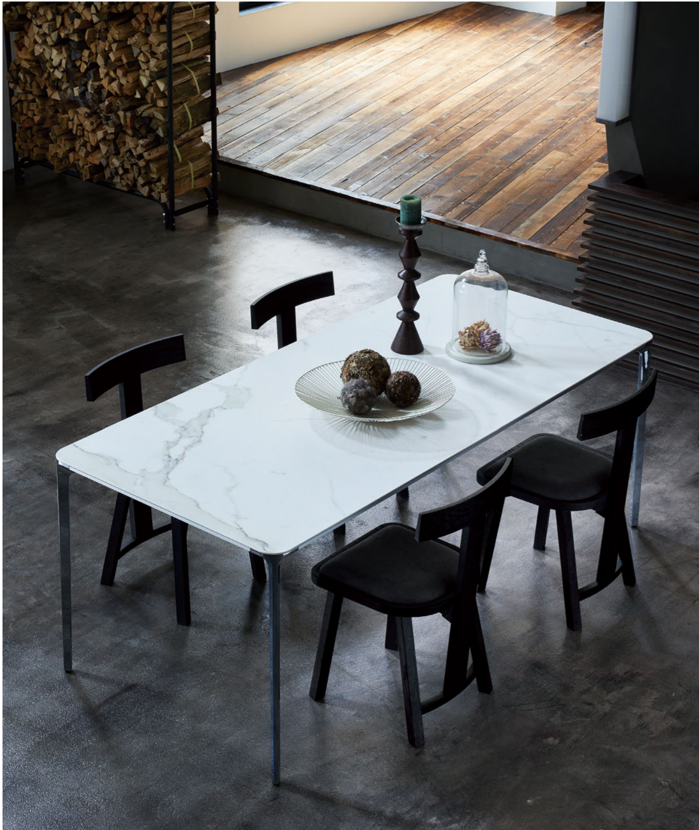
chair : MILLET