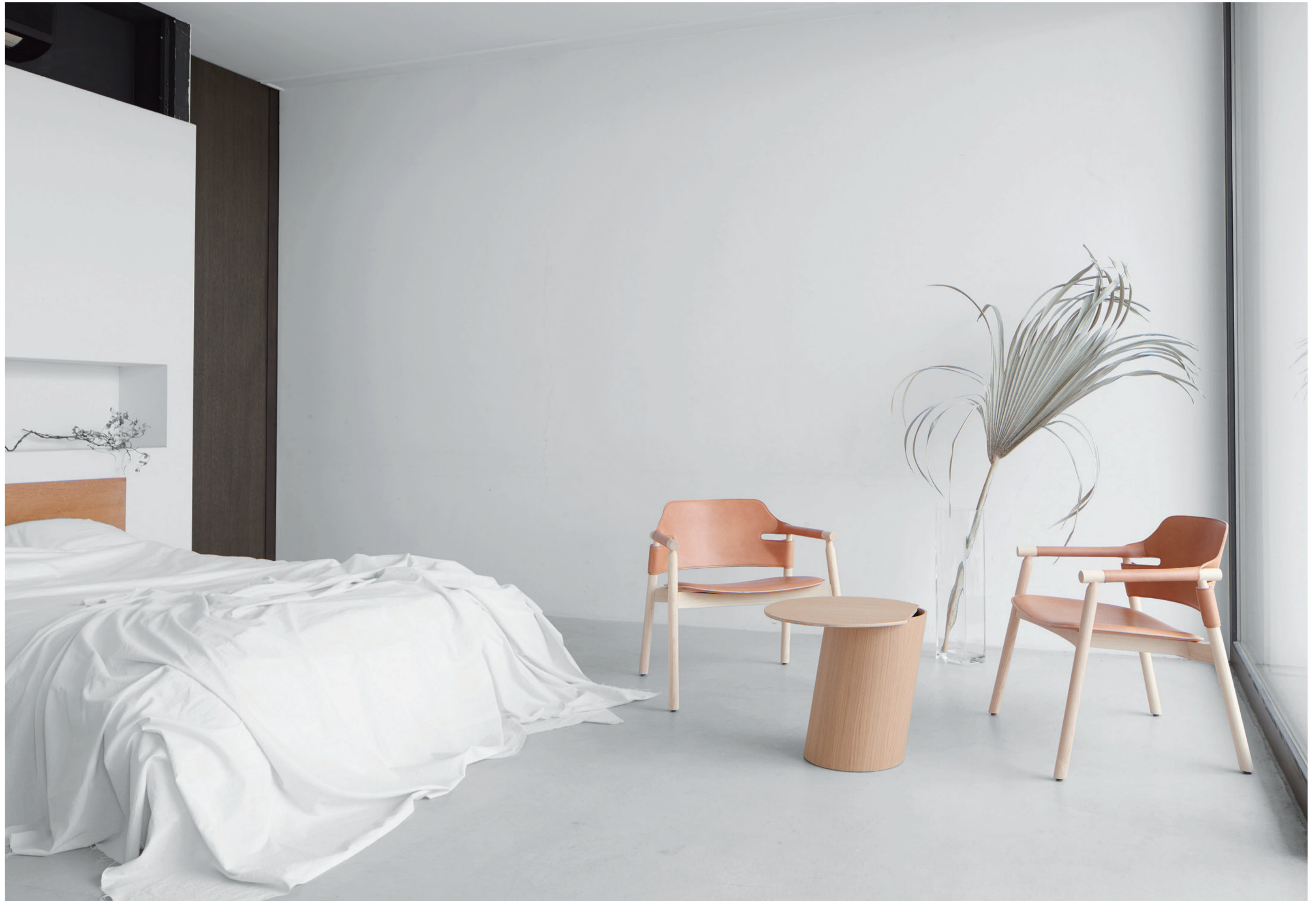
table : BIAS