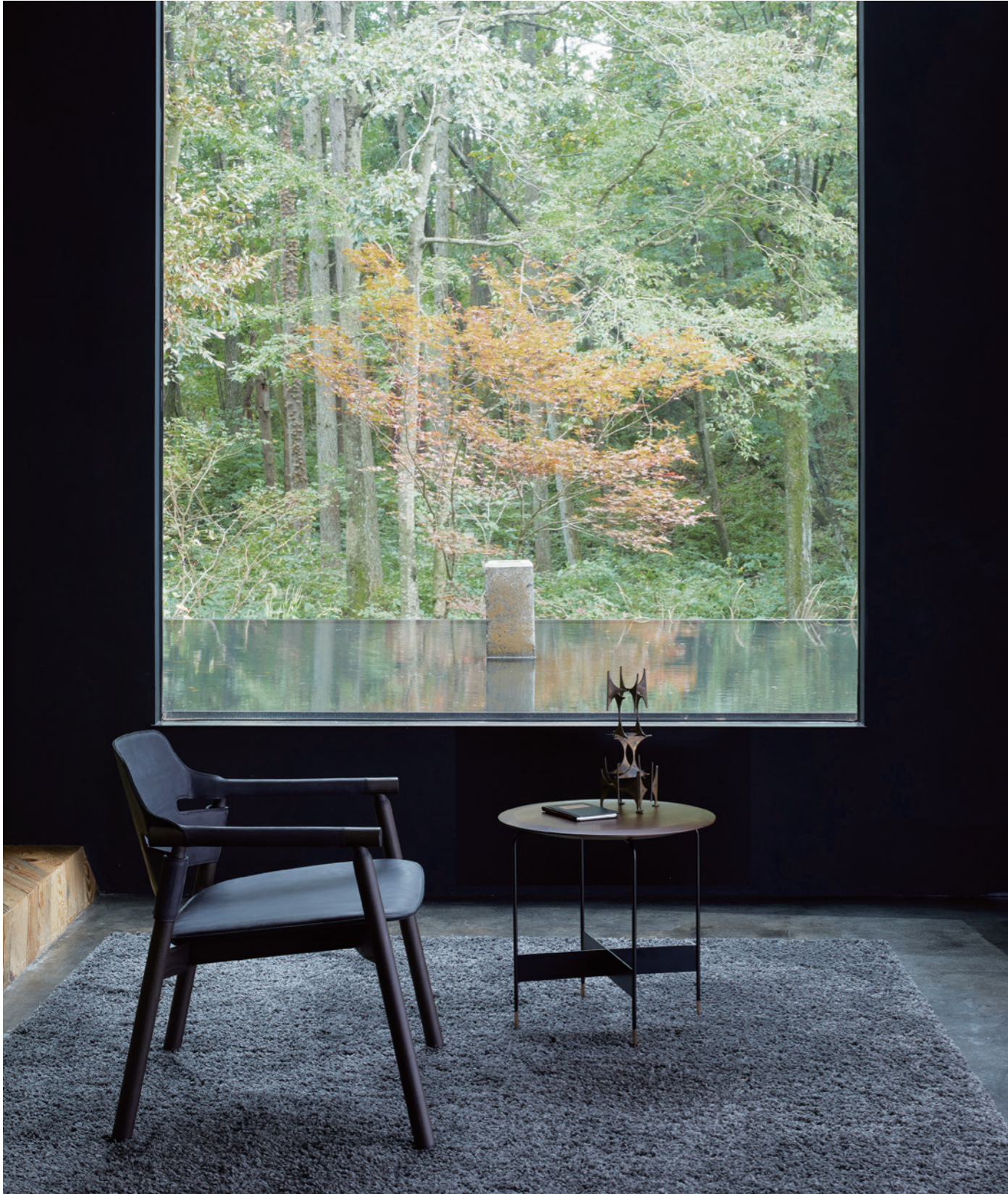
table : CIERO