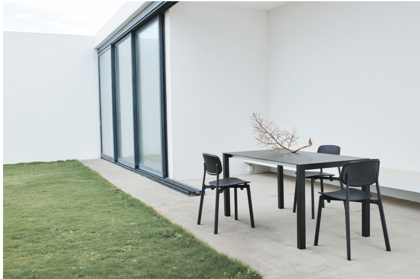
chair : COLANDER