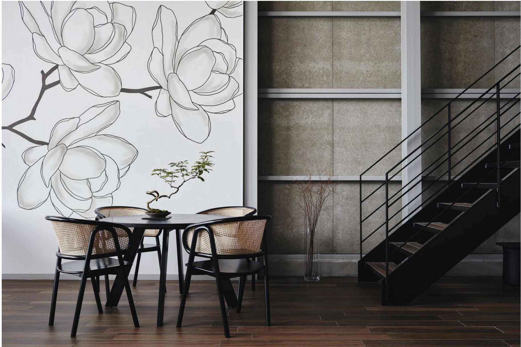
table : EIFFEL