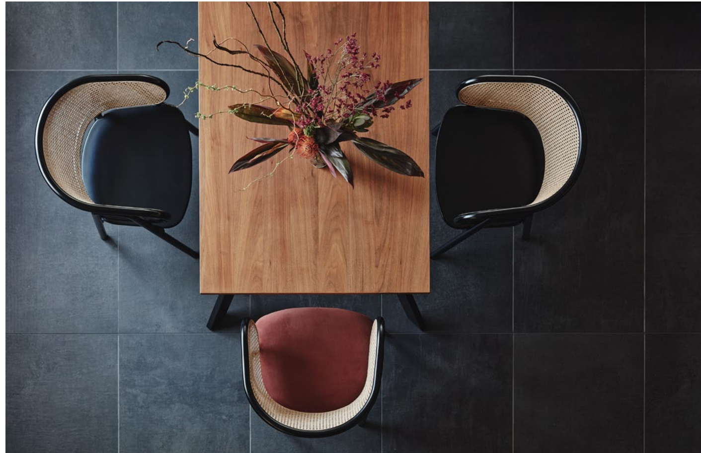
table : EIFFEL