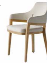
張地/ フランク US3916