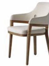
張地/ フランク US3916