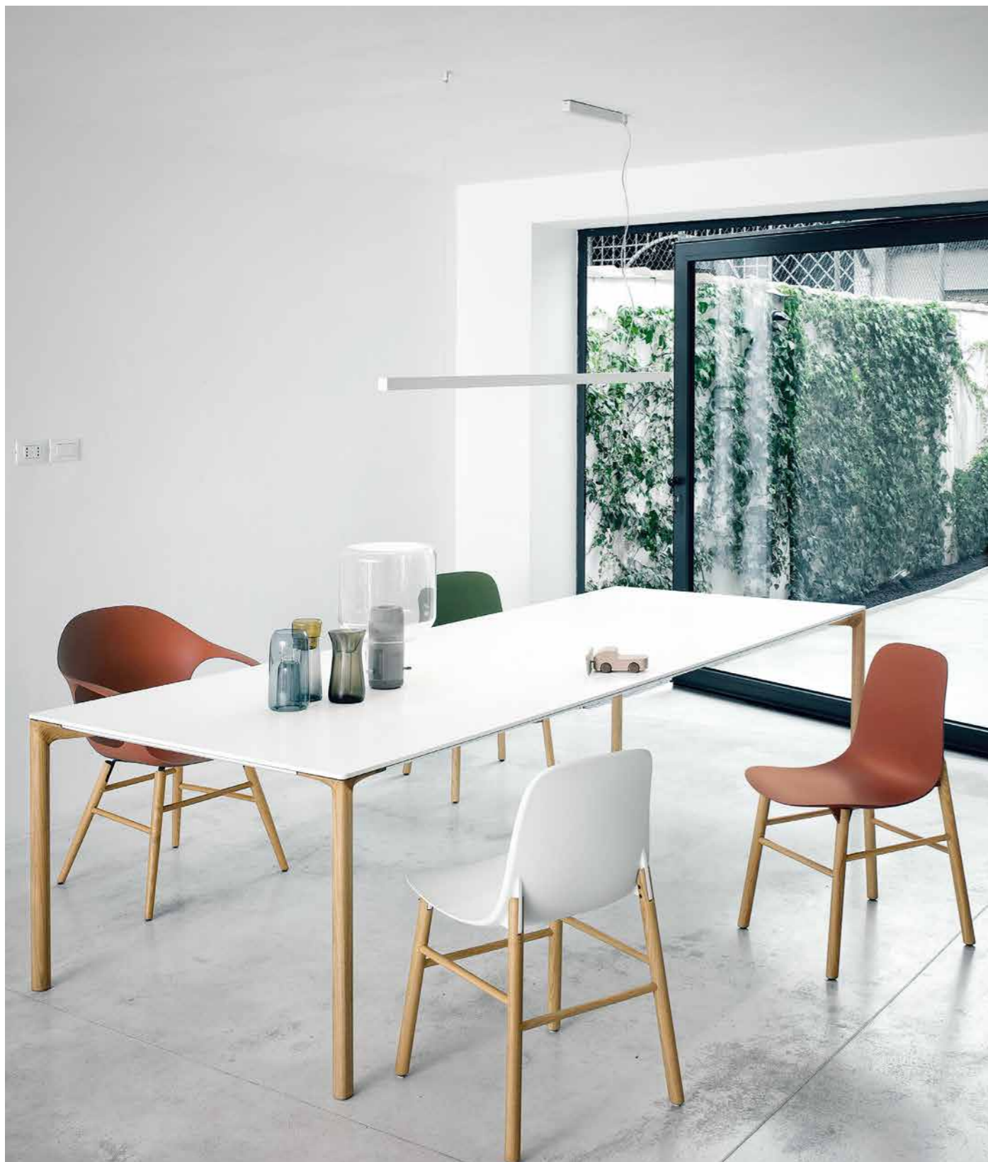
chair : ELEPHANT・SHARKY (参考商品)