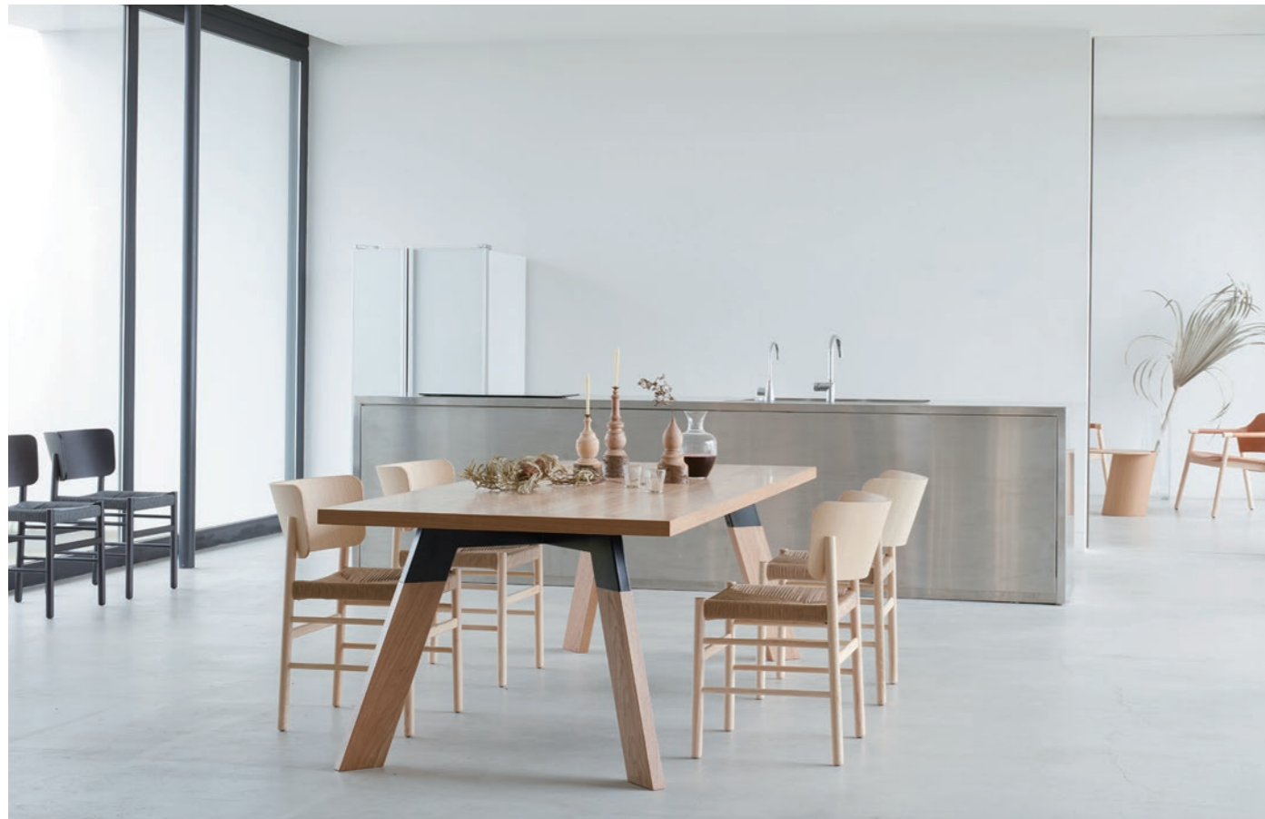
table : EIFFEL