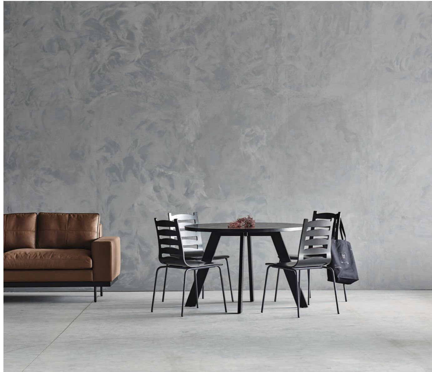
sofa : KUMO table : EIFFEL