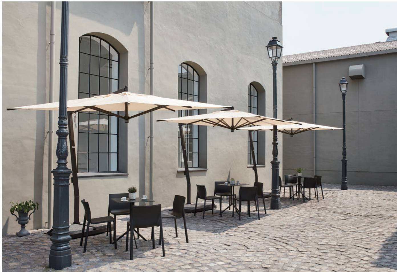
table : POULE

革新的な新素材は、時に家具のデザインにも革新をもたらします。2人組のデザインユニットLPは、野外・室内問わずにお使いいただけるスタッキングチェアを革新的なマテリアル「ガラス繊維強化射出成形ポリプロピレン」で生み出しました。