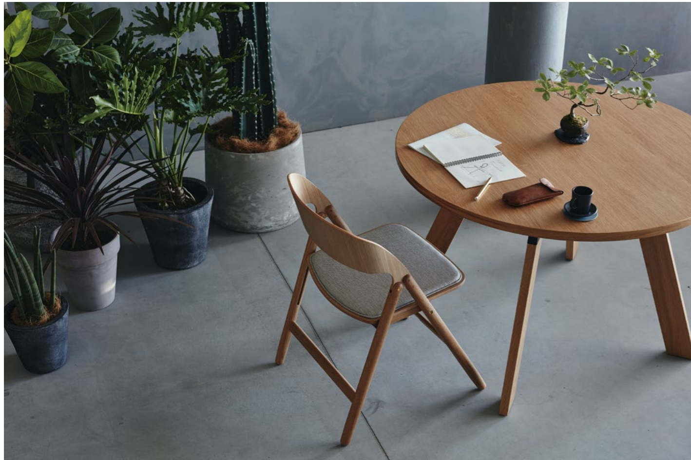
table : EIFFEL