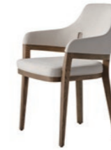
張地/ F ランク US3916