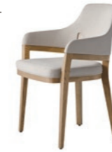
張地/ F ランク US3916