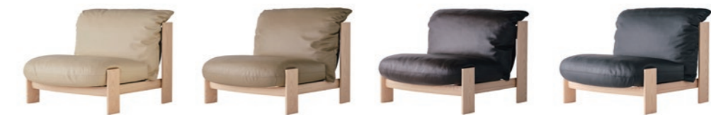
PA-I PA-E PA-B PA-K