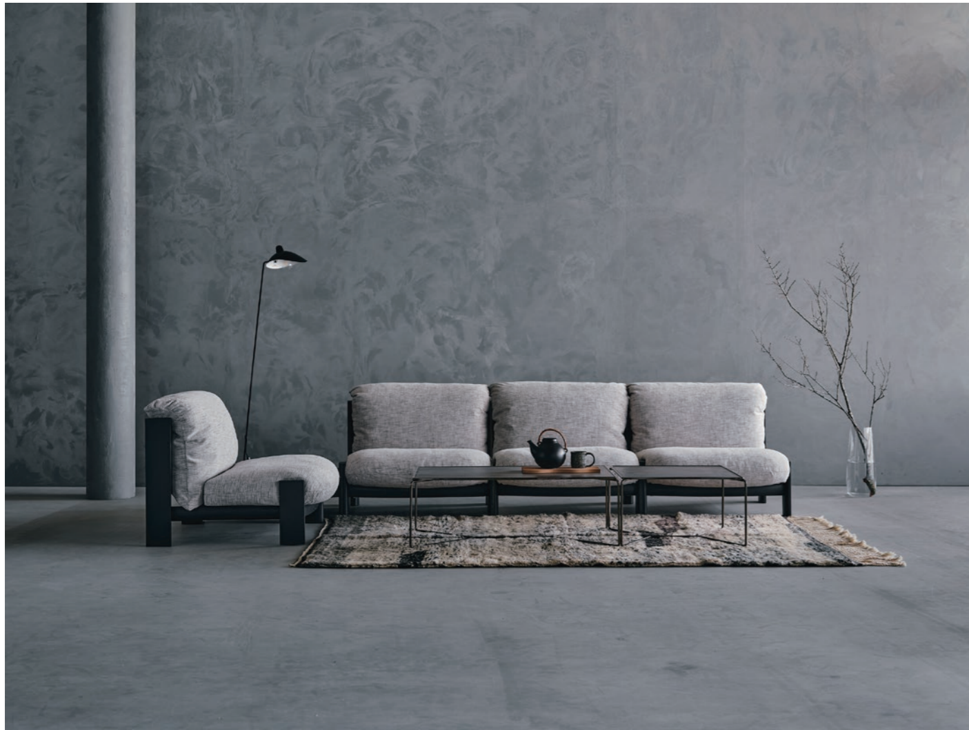
table : MARCEL